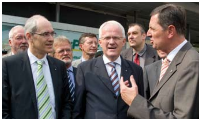
Stadt und Land Hand in Hand